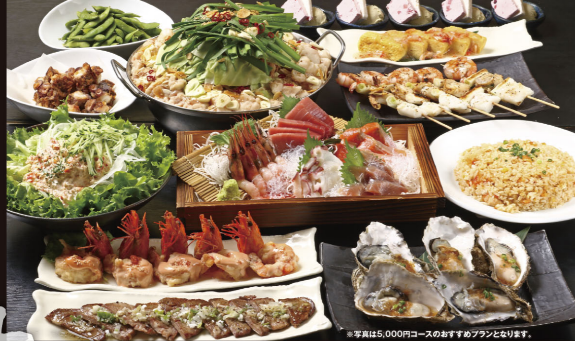
※写真は5,000円コースのおすすめプランとなります。