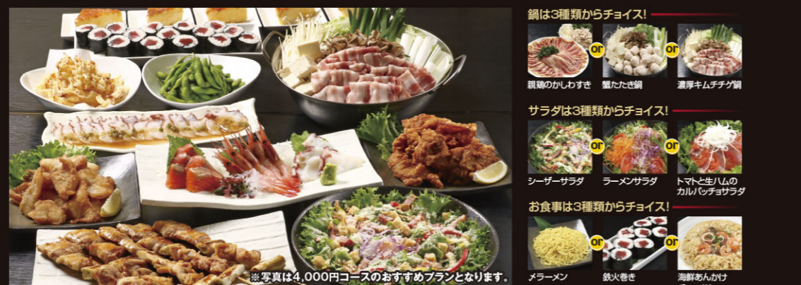
※写真は4,000円コースのおすすめプランとなります。