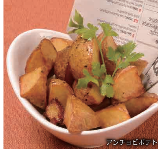
アンチョビポテト