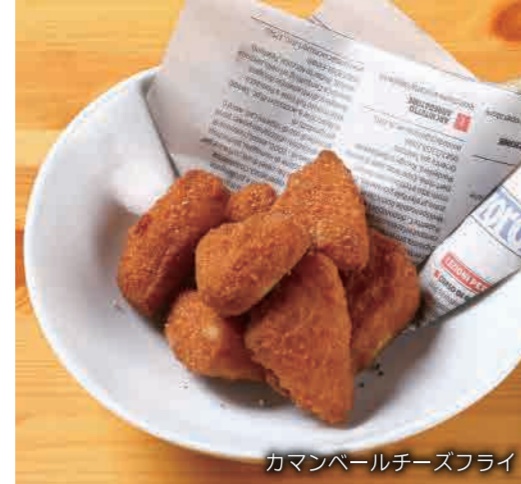
カマンベールチーズフライ