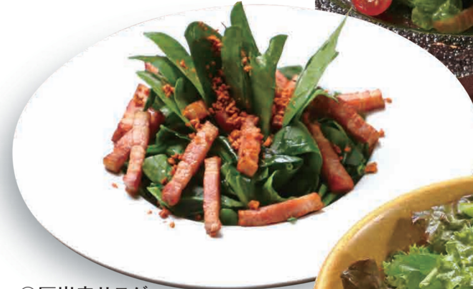
◎厚岸産サラダ ほうれん草ベーコン 780円