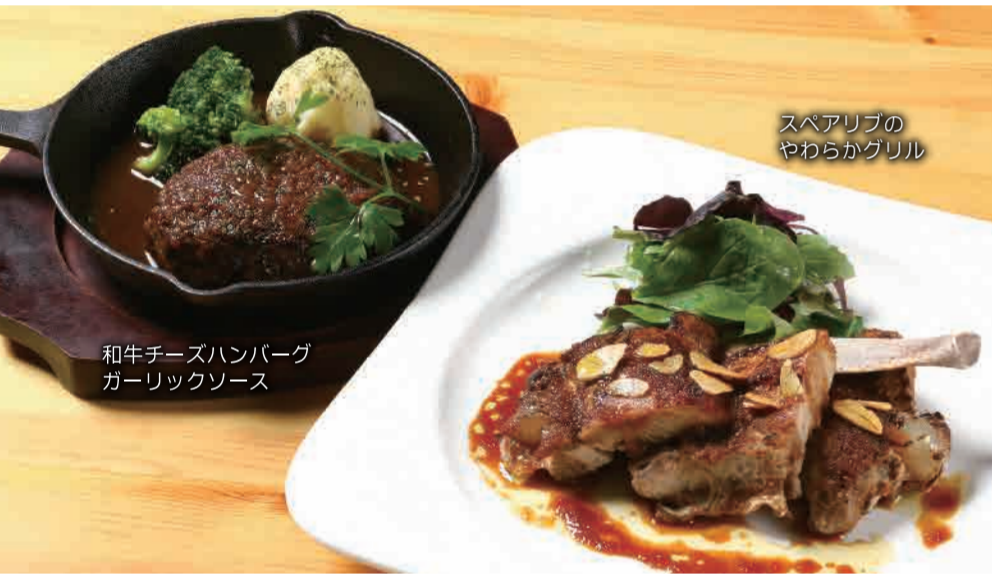
和牛チーズハンバーグ ガーリックソース