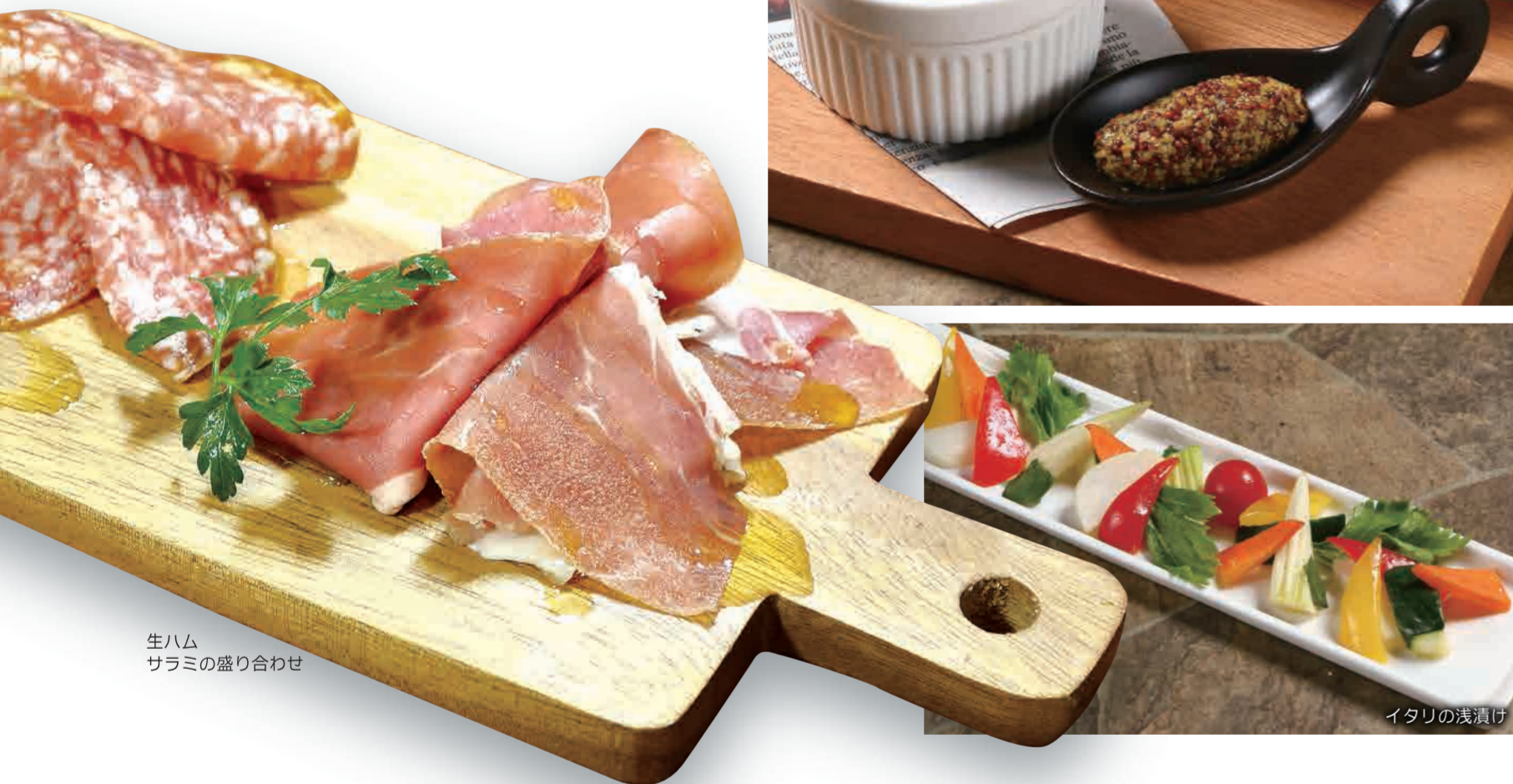
生ハム サラミの盛り合わせ