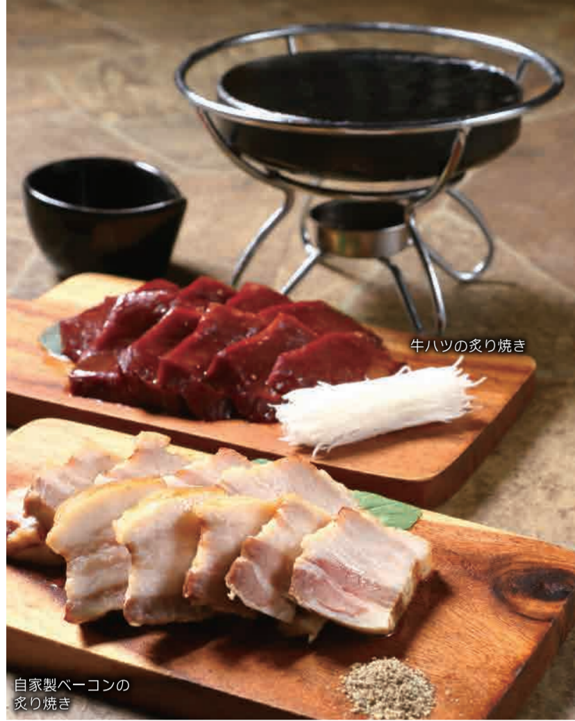
自家製ベーコンの炙り焼き