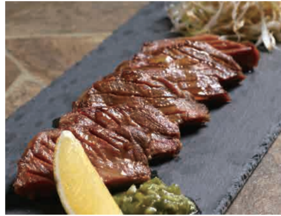
◎セサミ ネギ牛タン 880円