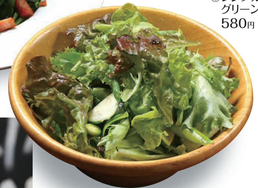
◎シンプルな グリーンサラダ 580円