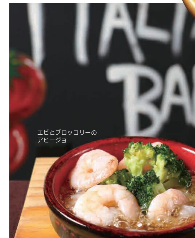
エビとブロッコリーの アヒージョ