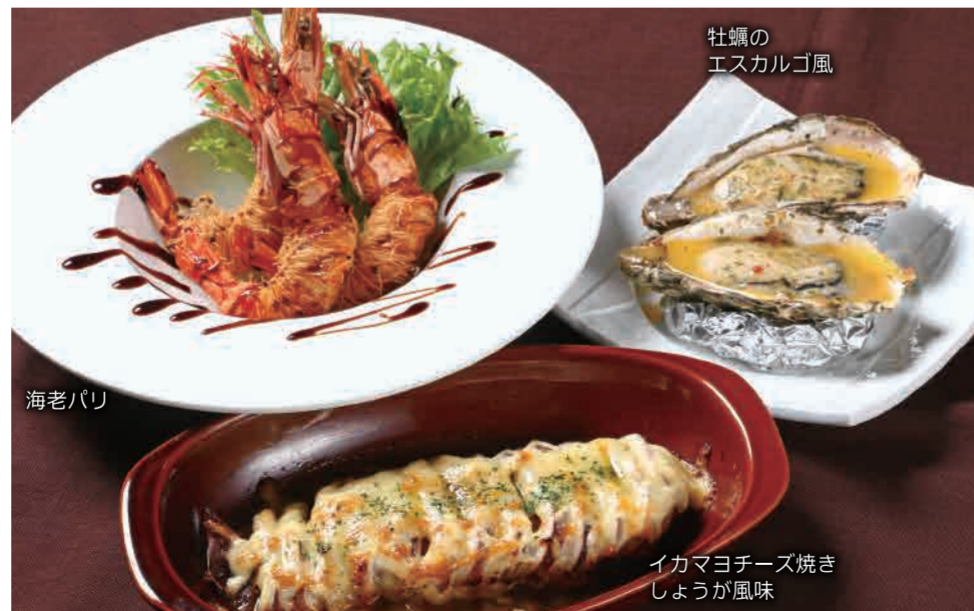
牡蠣の エスカルゴ風