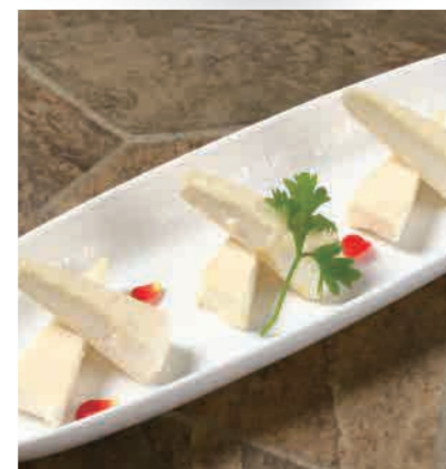
◎クリームチーズの 味噌漬け 350円