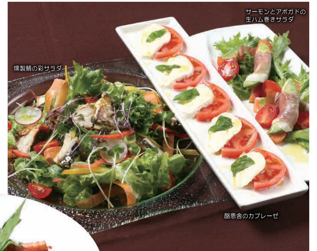
サーモンとアボガドの 生ハム巻きサラダ