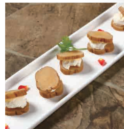
◎いぶりがっこ クリームチーズ 580円