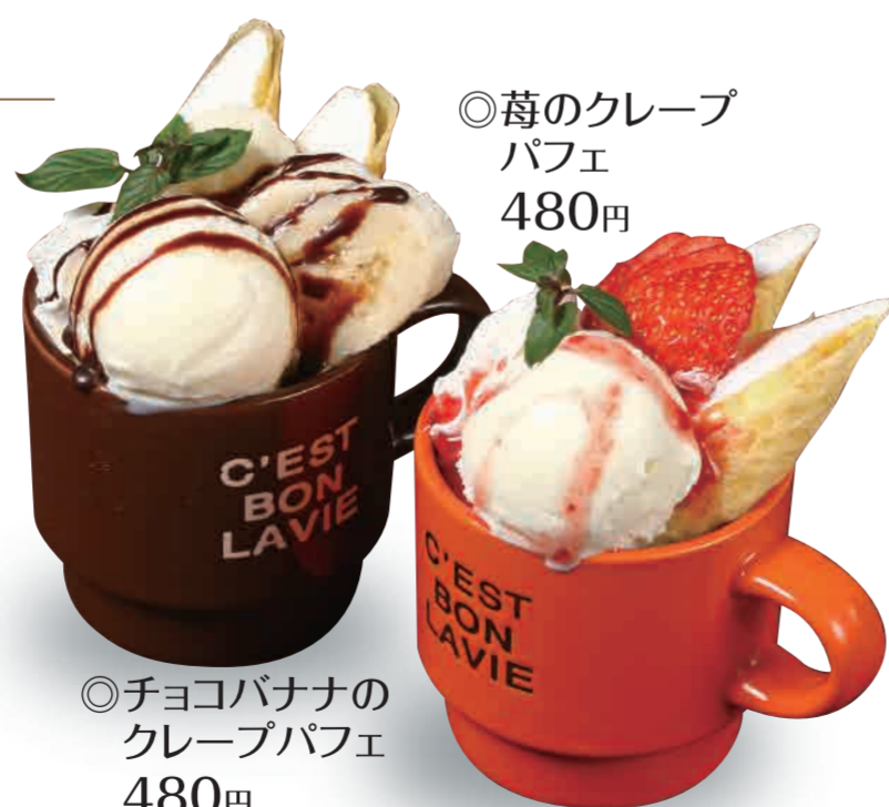
◎チョコバナナのクレープパフェ 480円